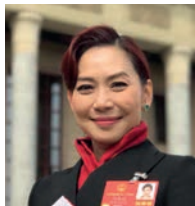
邝美云女士 JP 全国人大代表 香港珠海社团总会会长