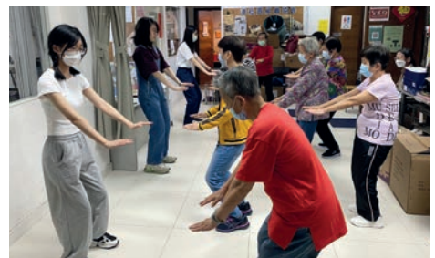
指导员们在社区指导长者学习，学以致用，服务社会。