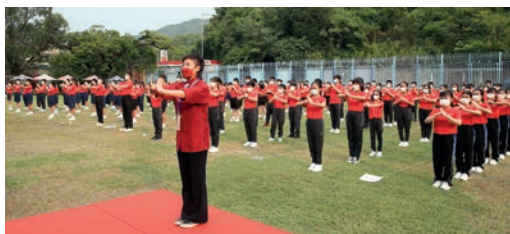
9月23日：香港太極青年慈善基金參與慶祝中華人民共和國成立73周年「少年獻瑞賀國慶浩然正氣功夫大匯演」