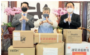
3月：香港湖北社團總會、國際體育大聯盟等送來一批防疫物資有需要的會員