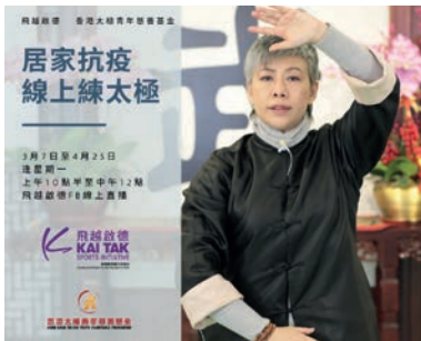
3月及4月：由飛越啟德及基金會共同籌備的「居家抗疫 線上練太極」線上直播課程