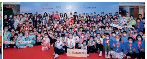
11月6日：2022-23年度得意寶慈善杯闖關賽首關在樂富廣場正式拉開帷幕，成功實踐本會「太極進社區」之規劃