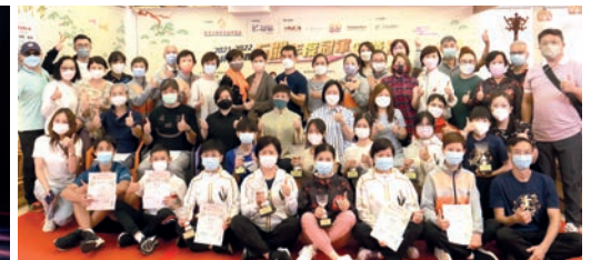
7月24日：2021-22年度慈善杯闖關賽年度頒獎禮成功舉辦