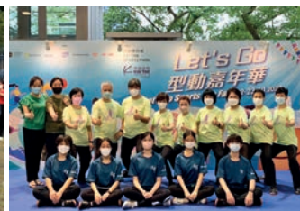
10月22日：基金會參與PMQ舉行的Letsgo型動嘉年華實踐「太極進社區」