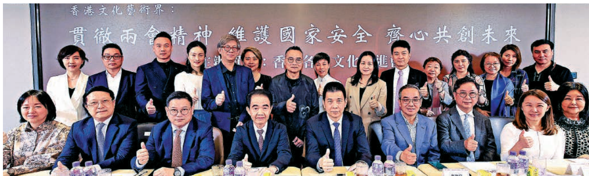
香港各界文化促進會於2023年4月17日舉行「香港文化藝術界：貫徹兩會精神維護國家安全齊心共創未來」座談會。